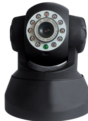
Referencia : KSN-I49MNS (Negra)