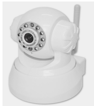
Referencia : KSN-I49MBS (Blanca)